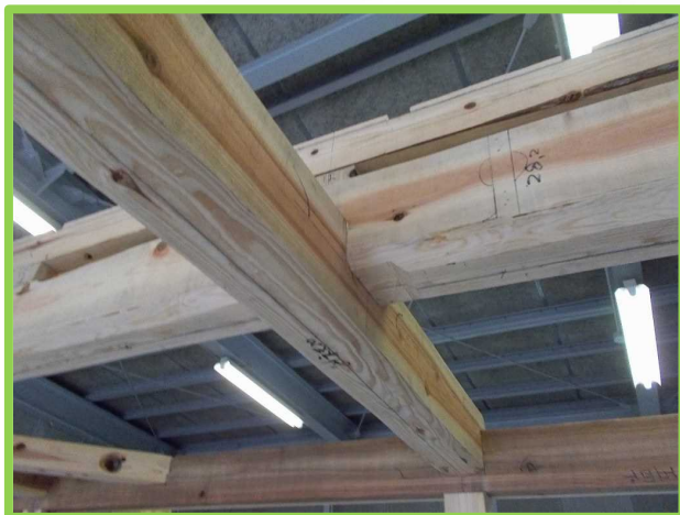
渡りあご (わたりあご)