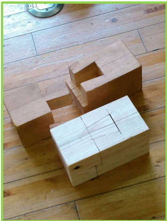
腰掛け蟻継ぎ (こしかけありつぎ)