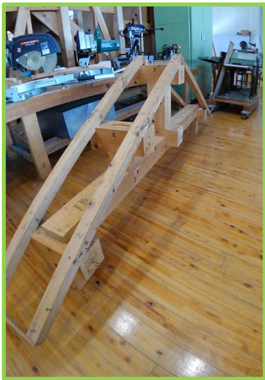
小屋組み訓練 (こやぐみくんれん)